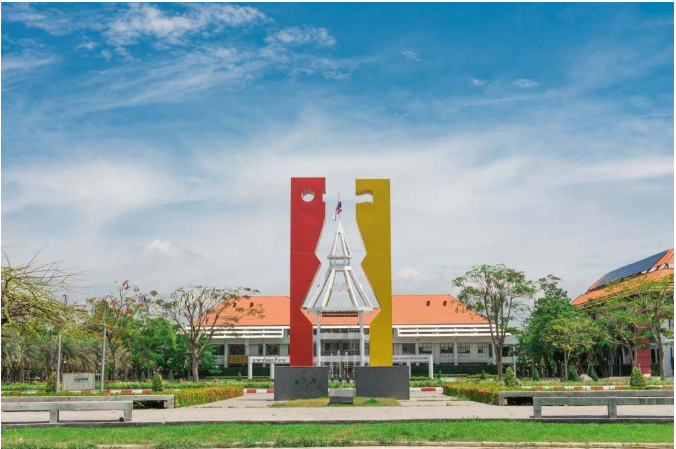
The article is in Thai

Tags: Thammasat University students invite create values graduation day occasion celebrate graduates bridge connecting opportunities society